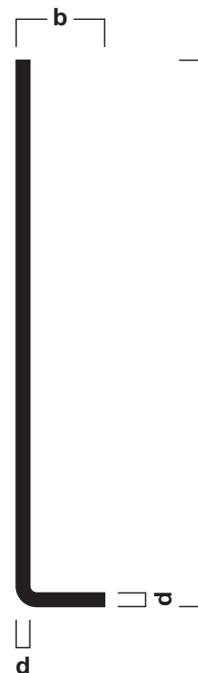
Abbildung zeigt das Sockelleistenprofil mit einer Abmessung von 80,0x13,0 mm mit einer Stärke von 2,0 mm.

Ausschreibungstext, CAD-Detail, Montagehinweis Direktanwahl: www.alu-plan.de / EDAPA90